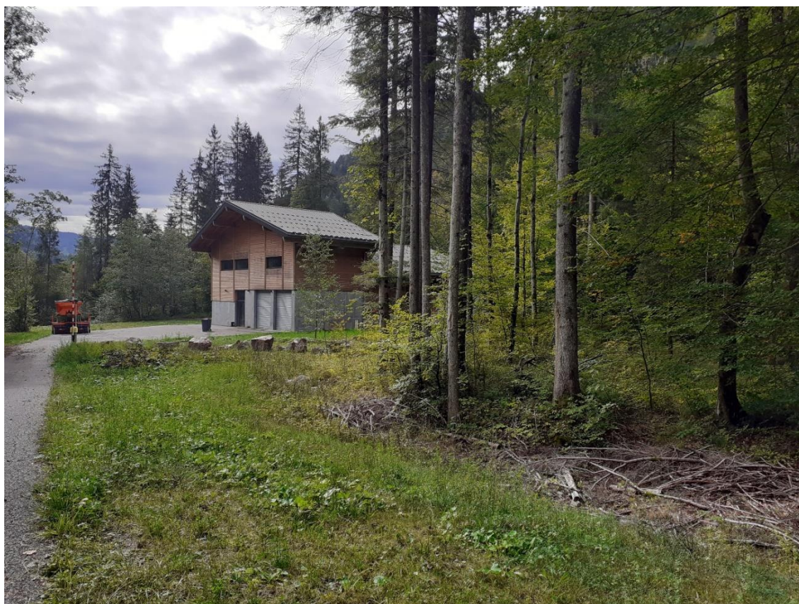
Figure 2: Emplacement du futur bâtiment usine. Date : 25/09/2019