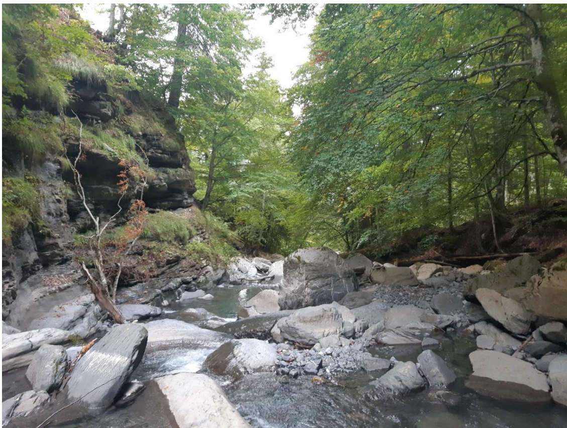
Figure 1: L'Arrondine au niveau de la future prise d'eau. Date : 25/09/2019