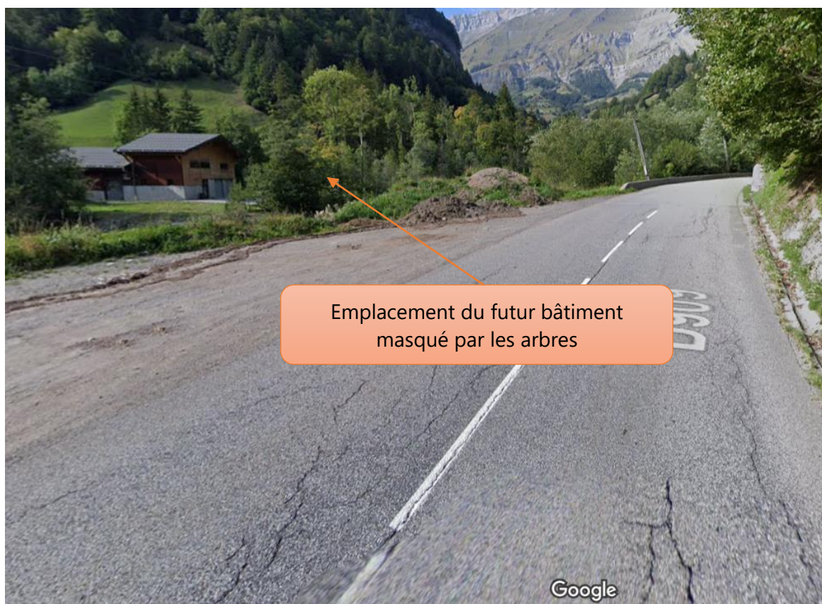
Figure 3: Vue du bâtiment depuis la D909.